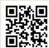
四万十町観光協会HP