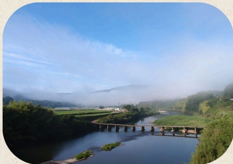
四万十川に架かる 沈下橋