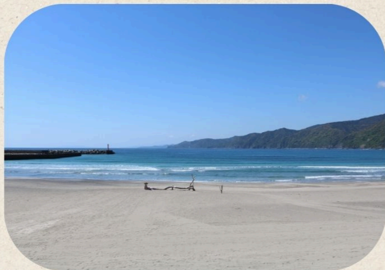
快水浴場百選に 選ばれた興津の海